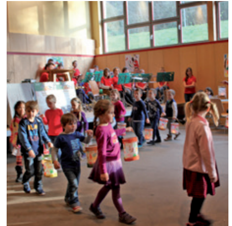
Kinder mit gebastelten Laternen.