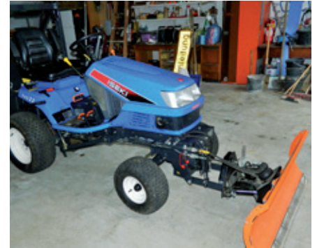
Auch neu: Iseki mit Schneeschild.