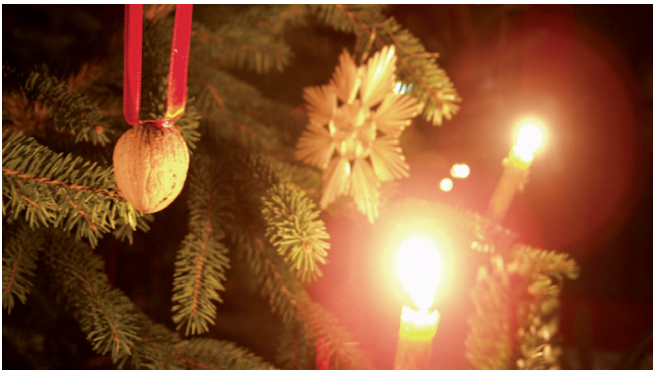
Frohe Weihnachten und ein glückliches neues Jahr in der Regionsgemeinde Riegersburg.

Regionsgemeinde Riegersburg informiert: Die kulinarischste Gemeinde Österreichs