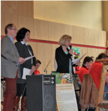
Präsentation des Erfahrungsraums.