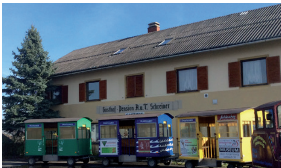
Das Gasthaus Schreiner wurde gemeinsam mit Anrainern ersteigert.

Das Gasthaus Schreiner wurde von der Marktgemeinde Riegersburg gemeinsam mit Anrainern gekauft. 30 Prozent der Kaufsumme wurde von Nachbarn aufgebracht. Damit wurde verhindert, dass das Gasthaus Schreiner in die Hände von Immobilienspekulanten fällt und ausschließlich unter dem Gesichtspunkt der Gewinnmaximierung verwertet wird. Für die Marktgemeinde und die Anrainer hat das Ziel, eine gesellschaftlich verträgliche Verwertung und in weiterer Folge Aufwertung der Immobilie zum Wohle der kulinarischsten Gemeinde Österreichs, oberste Priorität.