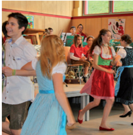
Jugendliche tanzten befreit auf.